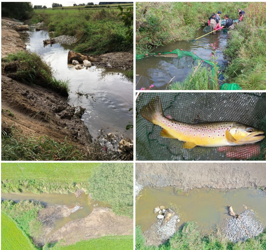
Abbildung 2: links oben und rechts unten: Einbau von Baumstämmen und Wasserbausteinen als Strömunglenker, rechts oben: Elektrofischung für die Erfolgskontrolle vor Umsetzung der Maßnahmen, rechts Mitte: Bachforelle in der Neufnach, links unten: Schaffung eine Altarmes